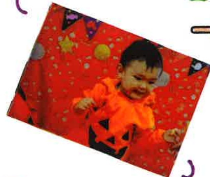
可愛い衣装を着て ハイポーズ!